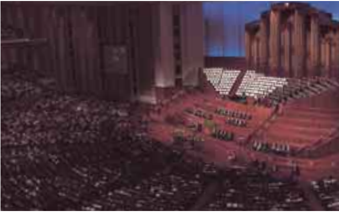
Das Konferenzzentrum ist bis auf den letzten Platz mit Jugendlichen und jungen Erwachsenen besetzt, die zuhören, was Präsident Gordon B. Hinckley ihnen rät.

Reich gehört, das der Herr in der letzten Evangeliumszeit der Fülle wiederhergestellt hat. Und warum hat er das getan? Damit ihr glücklich werdet.