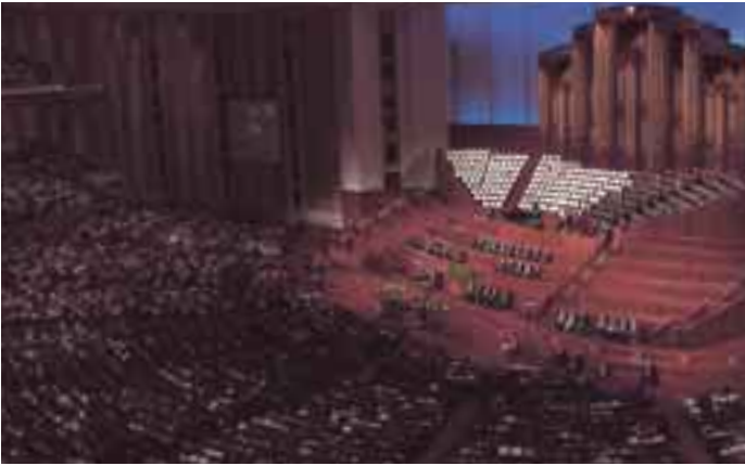
O Centro de Conferências ficou lotado de jovens e jovens adultos que foram ouvir os conselhos do Presidente Gordon B. Hinckley.

fiéis. Sejam verdadeiros, amados companheiros, neste reino grandioso.