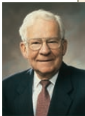
Vanhin Marvin J. Ashton

”Olen ajatellut monia asioita siitä asti, kun tulimme tähän kokoukseen. Allekirjoitan sen, mitä veli Ashton on sanonut. Luulenpa, että jos olisin perustamassa perhettä, haluaisin saada veli Ashtonin selittämät kaksitoista kohtaa ja noudattaisin itse niitä tarkoin ja opettaisin ne lapsilleni ja perheelleni ja jokaiselle, jonka kohtaisin. Ne ovat perusasioita. Koko elämäni ajan lapsuudestani asti olen kuullut johtavien veljien sanovan: ’Maksakaa velkanne älkääkä velkaantuko.’ Olin joitakin vuosia työssä pankkialalla ja näin, missä surkeassa tilanteessa monet ihmiset olivat, koska he eivät olleet päättäneet tuosta tärkeästä neuvosta.