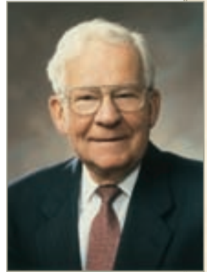
Elder Marvin J. Ashton

„Ich habe in dieser Versammlung über vieles nachgedacht. Ich schließe mich dem an, was Bruder Ashton gesagt hat. Ich denke, wenn ich jetzt eine Familie gründen würde, hätte ich gern die zwölf Punkte, die Bruder Ashton hier vorgetragen hat, und würde sie genau befolgen und sie meinen Kindern, meiner Familie und jedem, mit dem ich zu tun habe, vermitteln. Sie sind grundlegend. Schon als kleiner Junge habe ich die Führer der Kirche sagen hören: ‚Zahlt eure Schulden zurück und vermeidet Schulden.‘ Ich war ein paar Jahre bei einer Bank angestellt und habe die schlimme Lage vieler Menschen gesehen, die diesen wichtigen Rat ignoriert hatten.