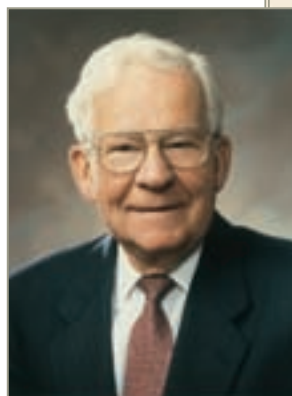
Anziano Marvin J. Ashton

«Ho pensato a molte cose prima di arrivare a questa riunione. Approvo ciò che ha detto il fratello Ashton. Credo che se avessi appena formato una famiglia, seguirei i dodici punti spiegati dal fratello Ashton e li insegnerei ai miei figli e a qualsiasi persona di cui venissi a conoscenza. Sono fondamentali. Per tutta la vita, sin dalla fanciullezza, ho sentito i Fratelli dire: «saldate i vostri debiti e non contraetene altri». Per alcuni anni ho lavorato in banca e ho visto la terribile situazione in cui si trovavano molte persone che ignoravano quei consigli importanti.