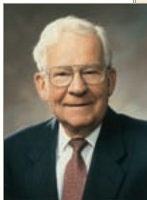
Старейшина Марвин Дж. Эштон

“Я о многом думаю с тех пор, как мы пришли на это собрание. Я присоединяюсь к тому, что сказал брат Эштон. Думаю, что если бы я сейчас начинал семейную жизнь, то мне бы захотелось знать эти двенадцать пунктов, которые разъяснил брат Эштон, неукоснительно следовать им самому и обучить им своих детей, семью и каждого из тех, с кем я общаюсь. Это главное. Всю жизнь, с самых юных лет я слышал, как Братья говорят: ‘Избавляйтесь от долгов и избегайте долгов’. Я проработал несколько лет в банках и видел ужасные ситуации, в которые попадали многие люди, потому что игнорировали это важное наставление.