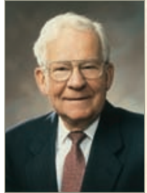
Äldste Marvin J Ashton

”Jag har fått många tankar under detta möte. Jag skriver under på det som broder Ashton har sagt. Om jag skulle bilda familj nu så skulle jag vilja ha tillgång till de tolv punkter som broder Ashton tagit upp och noggrant följa dem och lära ut dem till mina barn och min familj och alla jag kom i kontakt med. De är grundläggande. Ända sedan jag var liten har jag hört bröderna säga: 'Gör er skuldfria och håll er skuldfria.' Under några år arbetade jag inom bankväsendet och fick då se den fruktansvärda situation som många människor hamnat i därför att de nonchalerat detta viktiga råd.