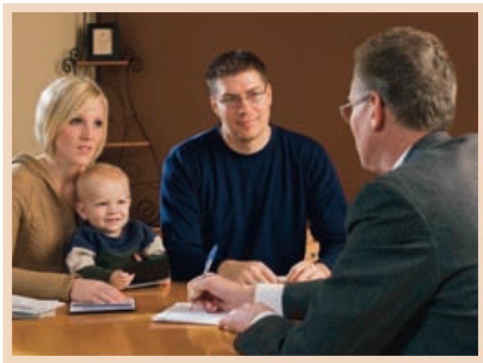
Peshkopi takohet me anëtarë nevojtarë dhe shqyrton mënyra sa më të mira për të dhënë ndihmë e për t'i ndihmuar që ata të vetëndihmohen.

Peshkopi ka mandat hyjnor t'i kërkojë me zell e të përkujdeset për të varfrit (shih DeB 84:112). Ai drejton punën e mirëqenies në degë. Synimi i tij është të ndihmojë anëtarët që të ndihmojnë vetveten e të bëhen të vetëmbështetur. (Për degët, presidenti i degës ka po të njëjtat përgjegjësi për mirëqenien.)