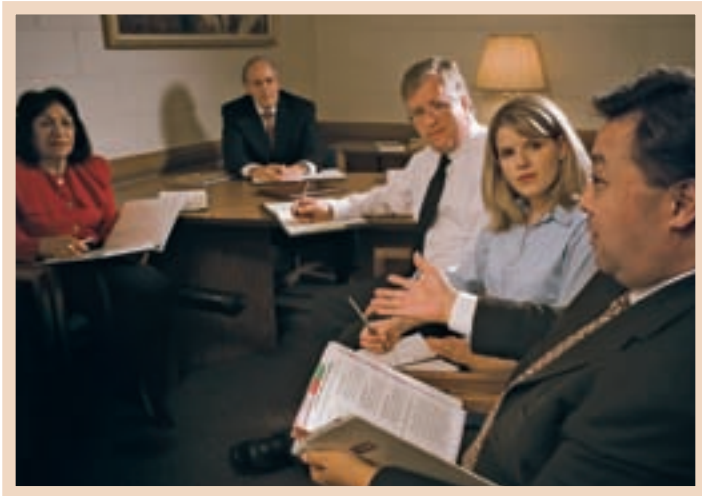
Եպիսկոպոսի ղեկավարության ներքո, ծխի խորհուրդը օգնում է լուծել բարօրության կարիքները:

ծոմապահության նվիրատվությունները կարելի է օգտագործել անհրաժեշտ ապրանքներ գնելու համար: